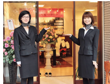
▲四ツ橋筋に面した同社マンションギャラリーにて

な同社が、分譲販売受託事業を次々と成功へ導いているのは、当然のことかもしれない。竣工物件では、共用部分の清掃や草抜き…販売中の物件を我が家のように大切に扱う同社に、入居者からも多くの応援の声が届くのも、納得のエピソードだ。ピルプワークが、まだまだ苦しいと言われる不動産市況の中において、今後も明るいニュースもたらしてくれることに期待したい。